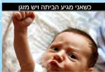
כשאני מגיע הביתה יש מזגן

נמאס לכם להרתיע מים בכל פעם שאתם רוצים להכין פסטה? הקפואו כמה ליטרים של מים רותחים והשתמשו בהם בכל עת. תודו לי אחר כך.